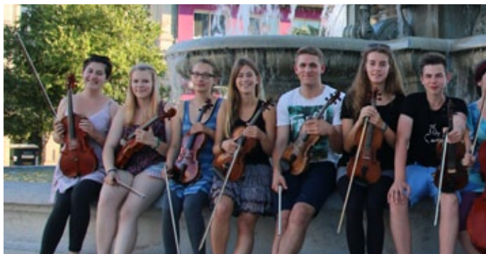
Foto: die Bluestrings auf Frankreichtournee.